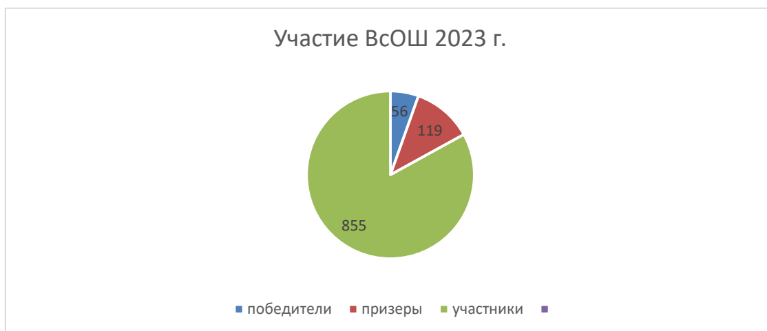
Диаграмма по результатам участия школьников во ВсОШ

Выводы: по сравнению с 2022 годом увеличилось количество участников, призеров и победителей.